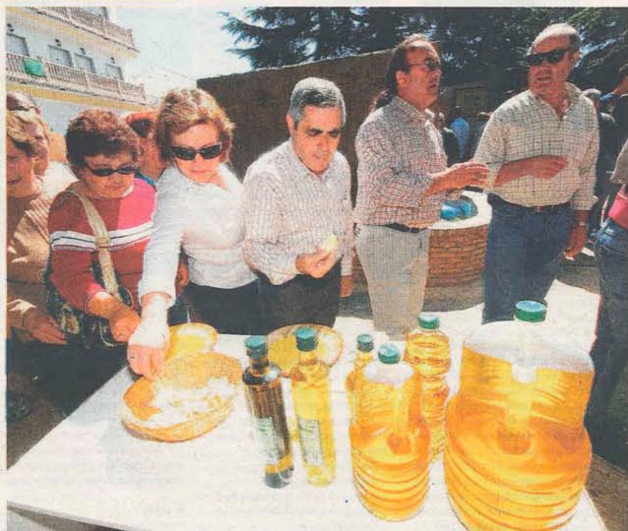
DEGUSTACIÓN. Los asistentes podrán saborear el domingo el famoso aceite verdial de Periana.